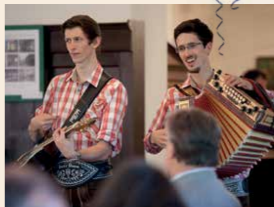
Dazu gab's die süffige Augustiner Halbe für nur € 2,-.

Da ein 5-jähriger ja kein richtig „runder“ Geburtstag ist hielt sich unser Feierprogramm auch etwas in Grenzen. Am Abend marschierten die „Fuchs-Buam“ ein, die der ein oder andere unserer Gäste noch von der Eröffnungsfeier kannte. Die beiden spielten mit Steirischer Harmonika, Gitarre, Wald- und Flügelhorn zünftig auf und sorgten für beste boarisch-musikalische Unterhaltung.