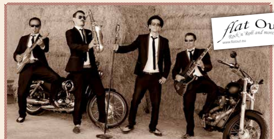
Schlechtwetter-Ausweichtermin: Freitag, 27. Juli!