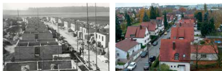
Der Bau der Siedlung Immastraße 1951/1952 – die Siedlung heute.

DACHBODENFUNDE GESUCHT Wer hat zuletzt daheim ausgemistet und dabei alte Bilder, Dokumente oder Gegenstände entdeckt, die etwas mit unserem Stadtteil Hadern zu tun haben (könnten) entdeckt? Der Geschichtsverein Hadern e.V., in dem der Haderner Augustiner Mitglied ist, sucht nach dem Motto „Uns interessiert alles!“ Belege für die lange Historie unseres rund 900 Jahre alten Stadtteils. Also bitte nicht entsorgen, sondern den Verein informieren. Weitere Infos gibt's hier: www.geschichtsverein-hadern.de! 🍷